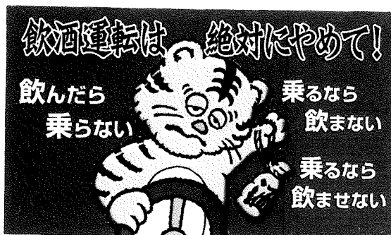
静岡市飲酒運転追放協議会